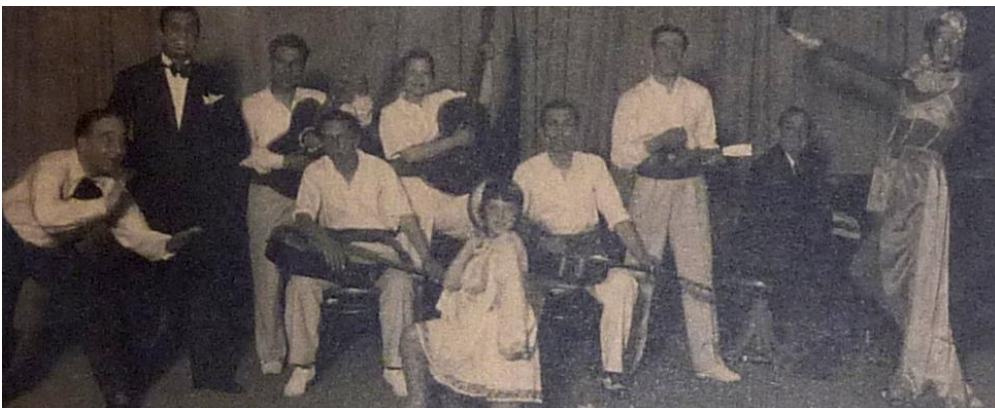
Μάντρα ΑΤΤΙΚ 1934

Βίντεο: https://www.youtube.com/watch?v=_FG2i4T5gLc